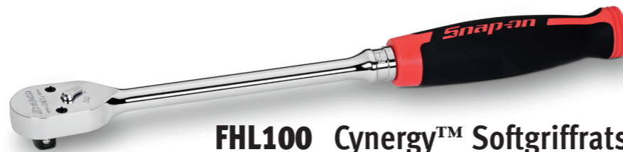
FHL100 Cynergy™ Softgriffratsche lang