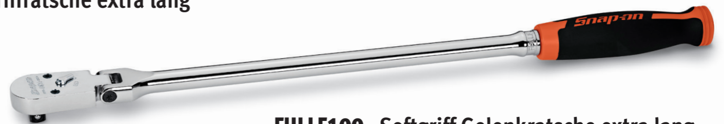
FHLLF100 Softgriff Gelenkratsche extra lang