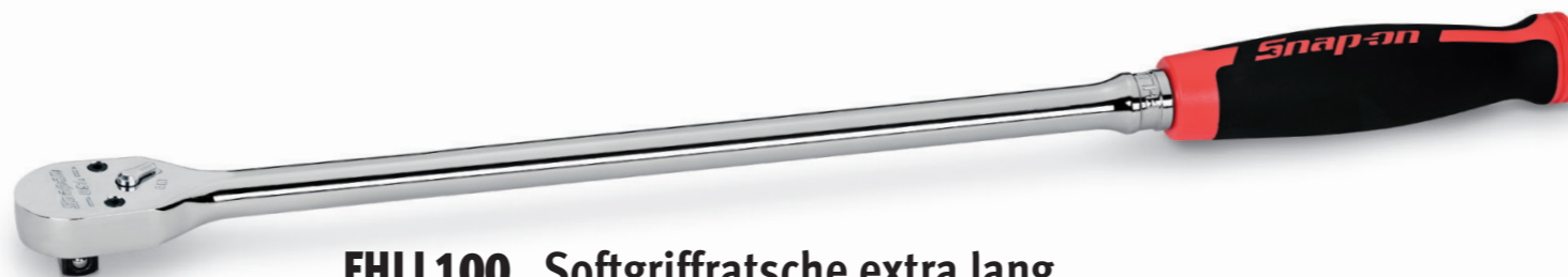
FHLL100 Softgriffratsche extra lang