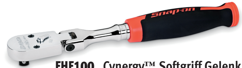
FHF100 Cynergy™ Softgriff Gelenkratsche