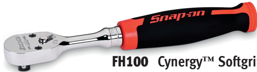
FH100 Cynergy™ Softgriff Standardratsche

Der Softgriff bietet Komfort und Kontrolle und ist beständig gegen die meisten Chemikalien in der Werkstatt