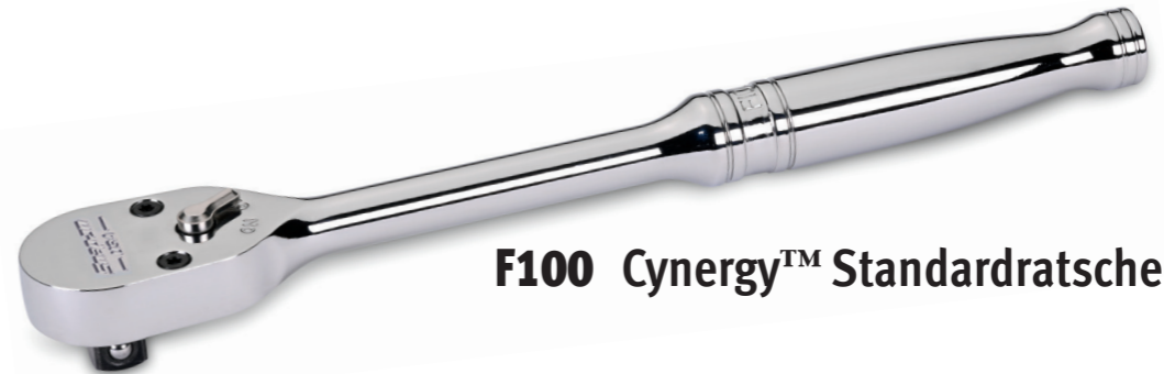
F100 Cynergy™ Standardratsche