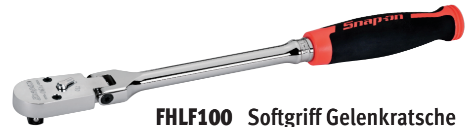
FHLF100 Softgriff Gelenkratsche lang