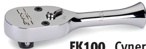
FK100 Cynergy™ Ratsche extra kurz