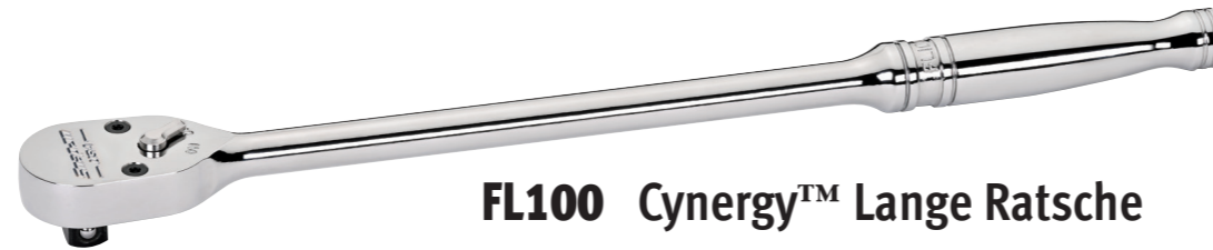
FL100 Cynergy™ Lange Ratsche

Größere Reichweite, höhere Hebelwirkung und Drehmomentabgabe bei weniger Kraftaufwand