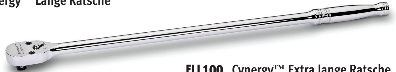
FLL100 Cynergy™ Extra lange Ratsche

Das Gelenkkopf-Design bietet außergewöhnliche Vielseitigkeit mit mehreren Positionen für bequemen Zugang zur Arbeit