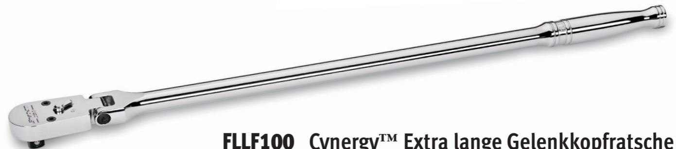
FLLF100 Cynergy™ Extra lange Gelenkkopfratsche