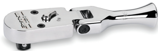
FKF100 Cynergy™ Extra kurze Gelenkratsche