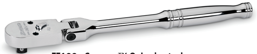
FF100 Cynergy™ Gelenkratsche