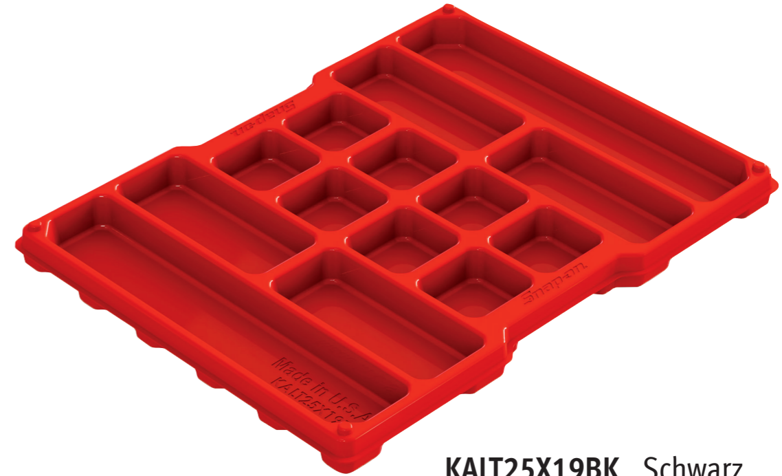
KALT25X19BK Schwarz KALT25X19RD Rot