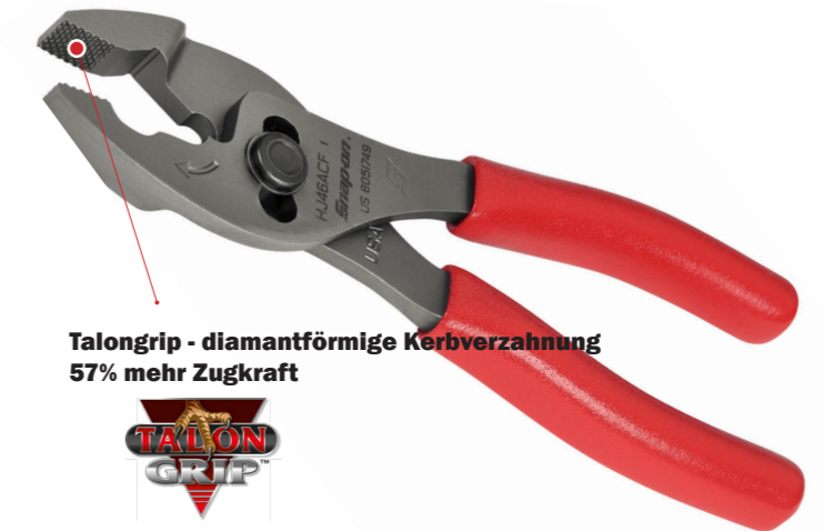
Talongrip - diamantförmige Kerbverzahnung 57% mehr Zugkraft