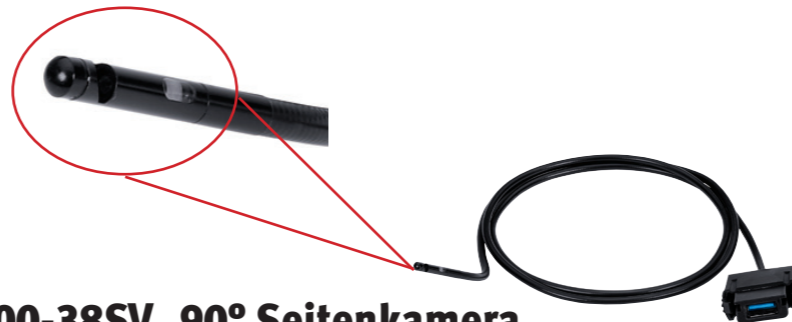
BK7000-38SV 90° Seitenkamera (Blickwinkel 117°)