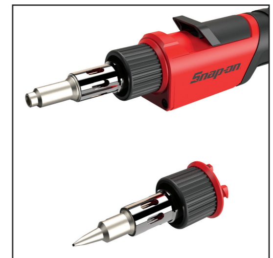
YAKS41HV - Neon