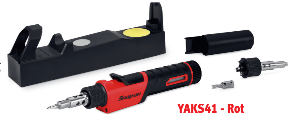
YAKS41 - Rot