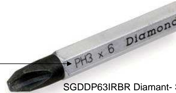
SGDDP63IRBR Diamant- Spitze

Hinweis: Starten Sie eine Schraube an einem Balken (50x100mm) und Sie werden den sicheren Sitz der Klinge spüren können.